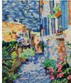
岩田愛子 花と緑の街路地 ルナの会賞