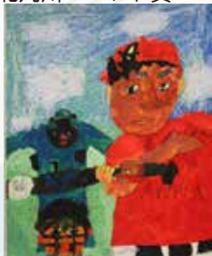
森本一途 3年生でがんばっている野球 もち吉賞