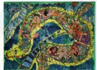
有吉ももこ 夜の大じゃジェットコ ースター こちらの企業も協賛していただきました。 にしやん