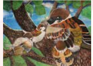
貞光菜月 すずめの親子