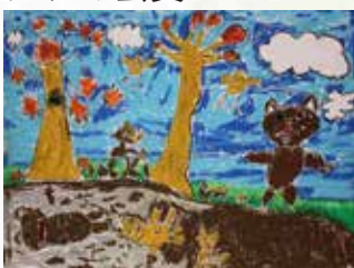
園田紘規 ふゆごもり みやはら書店賞