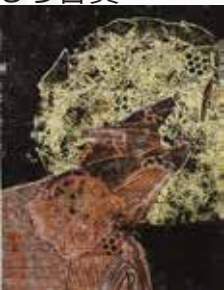
いわみつたける 月の前で鳴くオオカミ