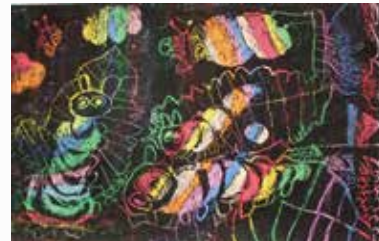
あらまきあずさ あお虫のやくそく