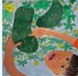
星本真樹 表面でこぼこなツルレイシ 直方 お仏壇のはせがわ賞