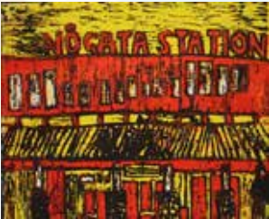
安藤蘭 直方駅 北九州ユニット賞